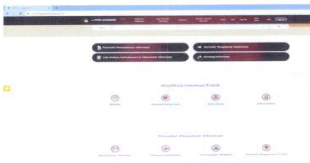
Insert: Laman E-PPID KPU Kabupaten Sumenep

Layanan E-PPID KPU RI ini adalah fasilitas yang disediakan dalam rangka memudahkan pemohon informasi publik agar pemohon juga tidak perlu datang langsung ke Kantor KPU Kabupaten Sumenep, dengan menggunakan saluran internet untuk berkomunikasi dengan PPID KPU Kabupaten Sumenep. Sejalan dengan situasi dan kondisi terkini yang mana dunia masih ada dalam masa pandemic Corona Virus Disease 2019, atau COVID-19, maka fasilitas permohonan Informasi yang dilayangkan secara daring melalui E-PPID terbilang sebagai cara nyaman dan aman. Adapun laman E-PPID KPU Kabupaten Sumenep dapat diakses melalui https://sumenepkabppid.kpu.go.id/ .